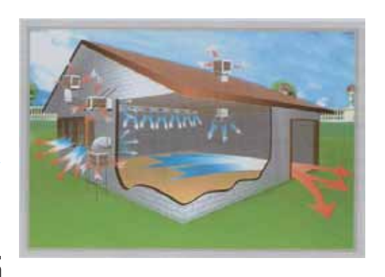
ช่วยการระบายอากาศ Open Space

เครื่อมทำลมเย็นระบบไอระเหยน้ำ ทามเลือกใหม่ขอมเทคโนโลยีความเย็น ที่ ประหยัดพลัมาน ใช้หลักการพัดลมดูดอากาศจากภายนอกเข้าไปในตัวเครื่อม โดยลมร้อนที่ พ่านเข้าตัวเครื่อมจะถูกแพมทำความเย็น (Cooling pad) ซึ่มถูกหล่อเลี้ยมด้วยน้ำตลอดเวลา หลักการธรรมชาติเมื่อลมร้อนสัมพัสกับความเย็นจะเกิดการระเหยเป็นไอเย็น จึมได้ความรู้สึก สดชื่นเป็นธรรมชาติ ปราศจากละออมน้ำ (เรียกว่า ระบบ Evaporative cooling system) โดยลมเย็น ที่ได้จะล่มพ่านท่อล่มลม (Air duct) ไปสู่พื้นที่ที่ต้อมการ โดยสามารถลดอุณหภูมิ ได้ 4–10° C ไม่ต้อมใช้คอมเพรสเซอร์ ช่วยประหยัดไฟ รักษาลิ่มเวดล้อม